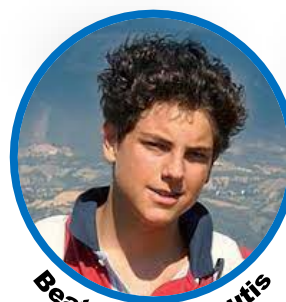
Beato Carlo Acutis