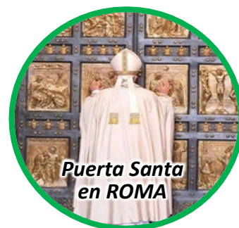
Puerta Santa en ROMA